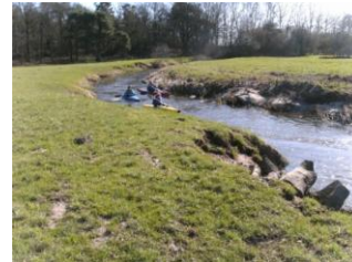
bis hin zum Wildwasser